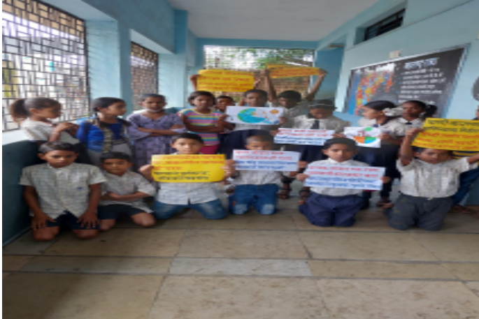
गोदावरी नदी प्रदूषण नियंत्रण जागृती प्रभात फेरी मनपा शाळा ९ फुलेनगर